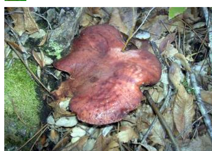
Fistulina hepatica (Língua de vaca)