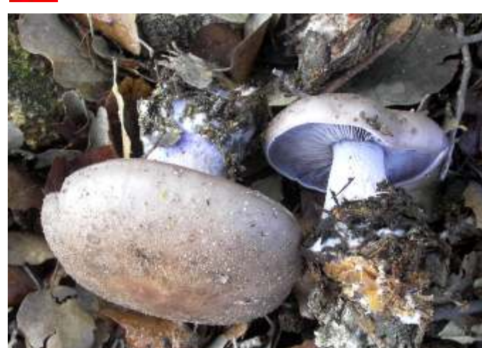
Lepista nuda (Pé azul)