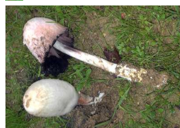
Coprinus comatus (Cabeludo)