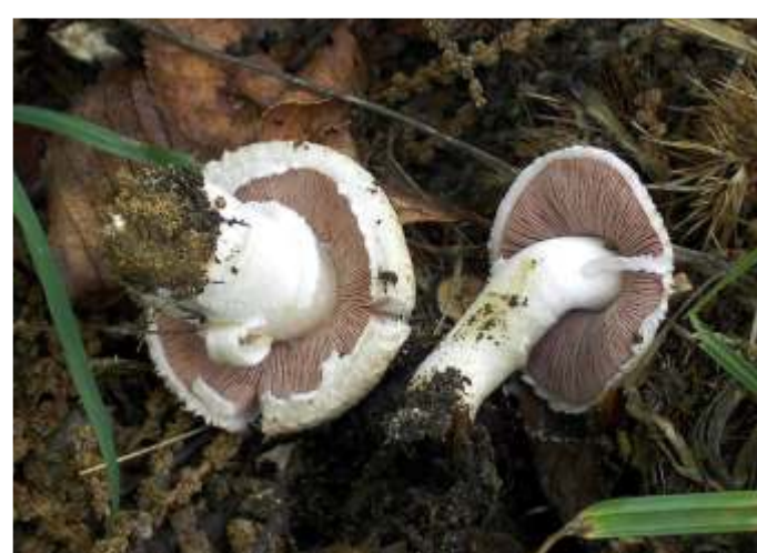
Agaricus campestris (Rosa dos prados)