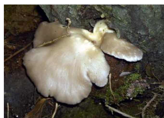
Pleurotus ostreatus (Repolga)