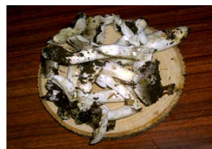
Tricholoma portentosum (Miscaro branco)

Autor: José Luís Gravito Henriques, Eng. Agrónomo Com base em Inquérito