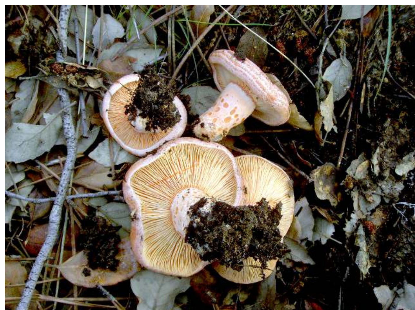
Lactarius deliciosus (Sancha)