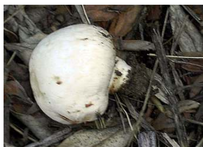
Agaricus bisporus (Agárico dos jardins)