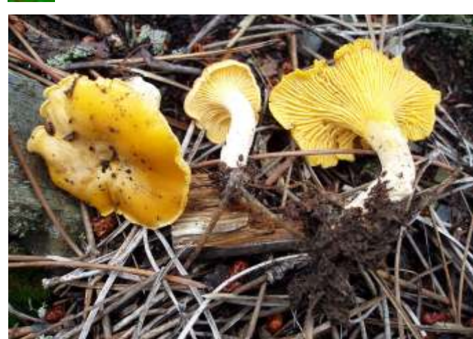
Cantharellus cibarius (Cantarelo)