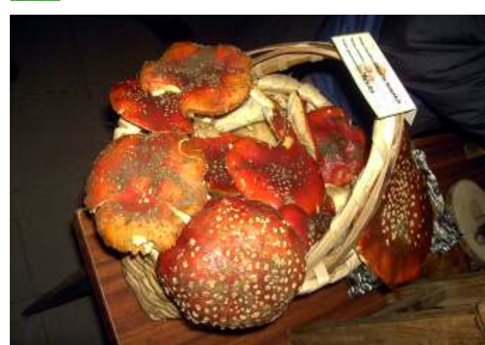
Amanita muscaria (Mata moscas)