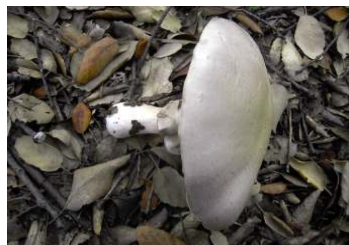
Agaricus sylvicola (Agárico da floresta)