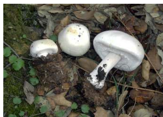
Agaricus arvensis (Bola de neve)