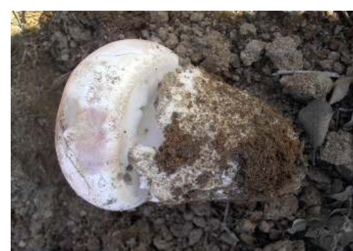
Amanita ponderosa (Tortulho)