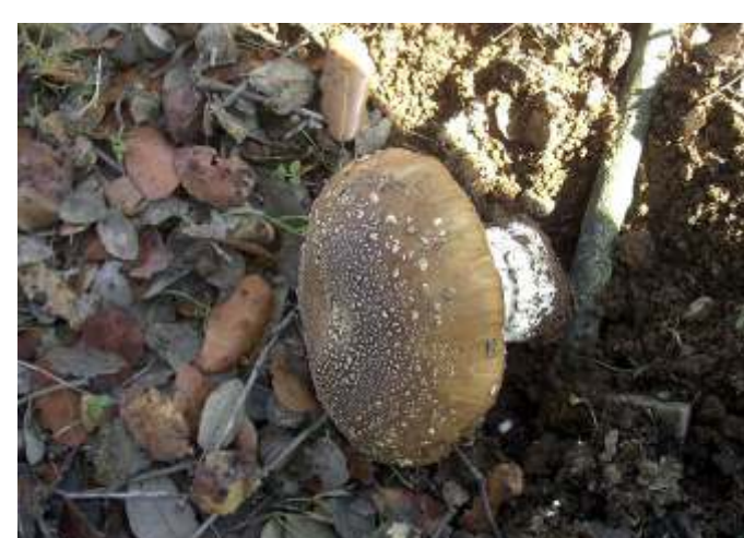
Amanita pantherina (Pantera)