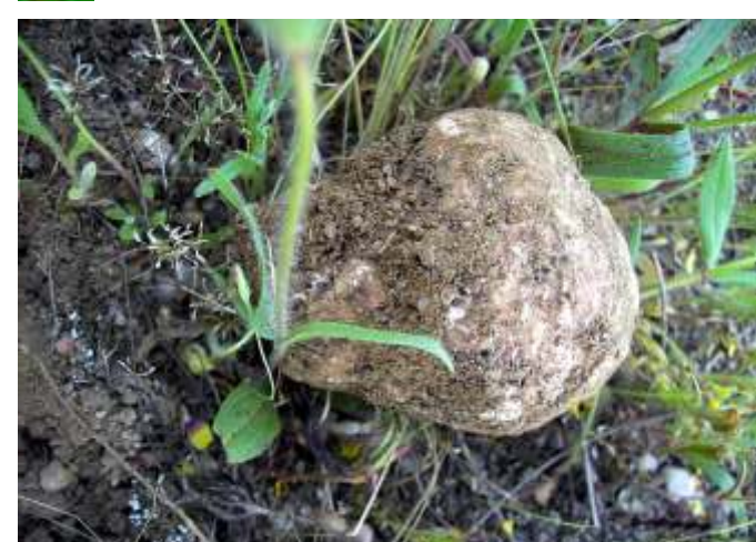
Terfezia arenaria (Criadilha)