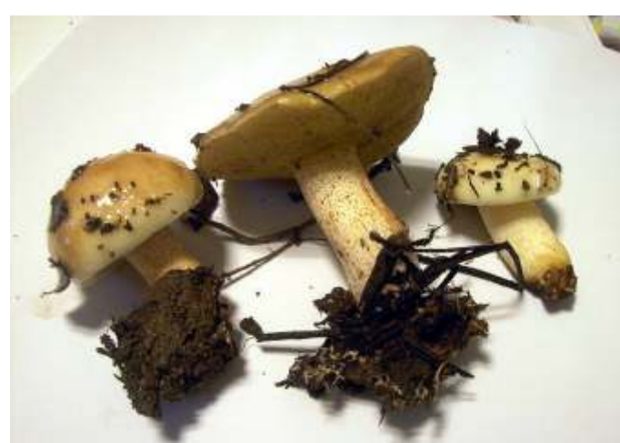
Suillus bellinii (Suito)