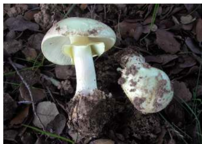
Amanita citrina (Miscaro limão)