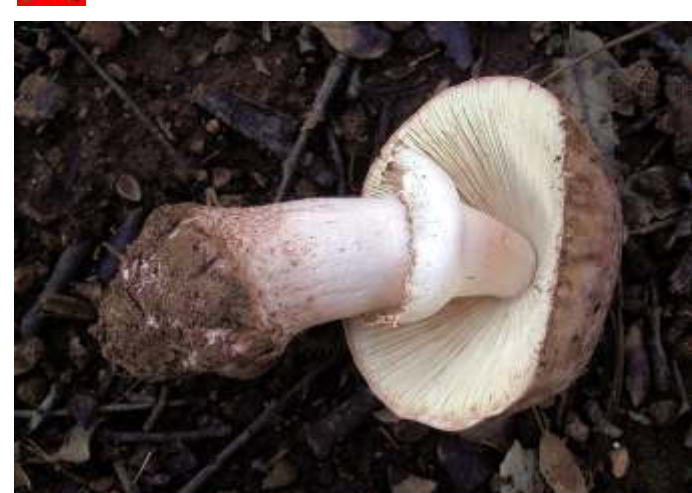
Amanita rubescens (Pé vermelho)