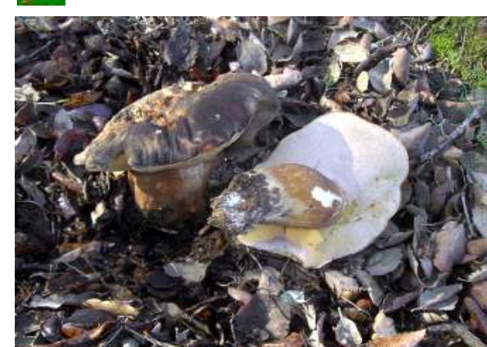
Boletus aereus (Boleto escuro)