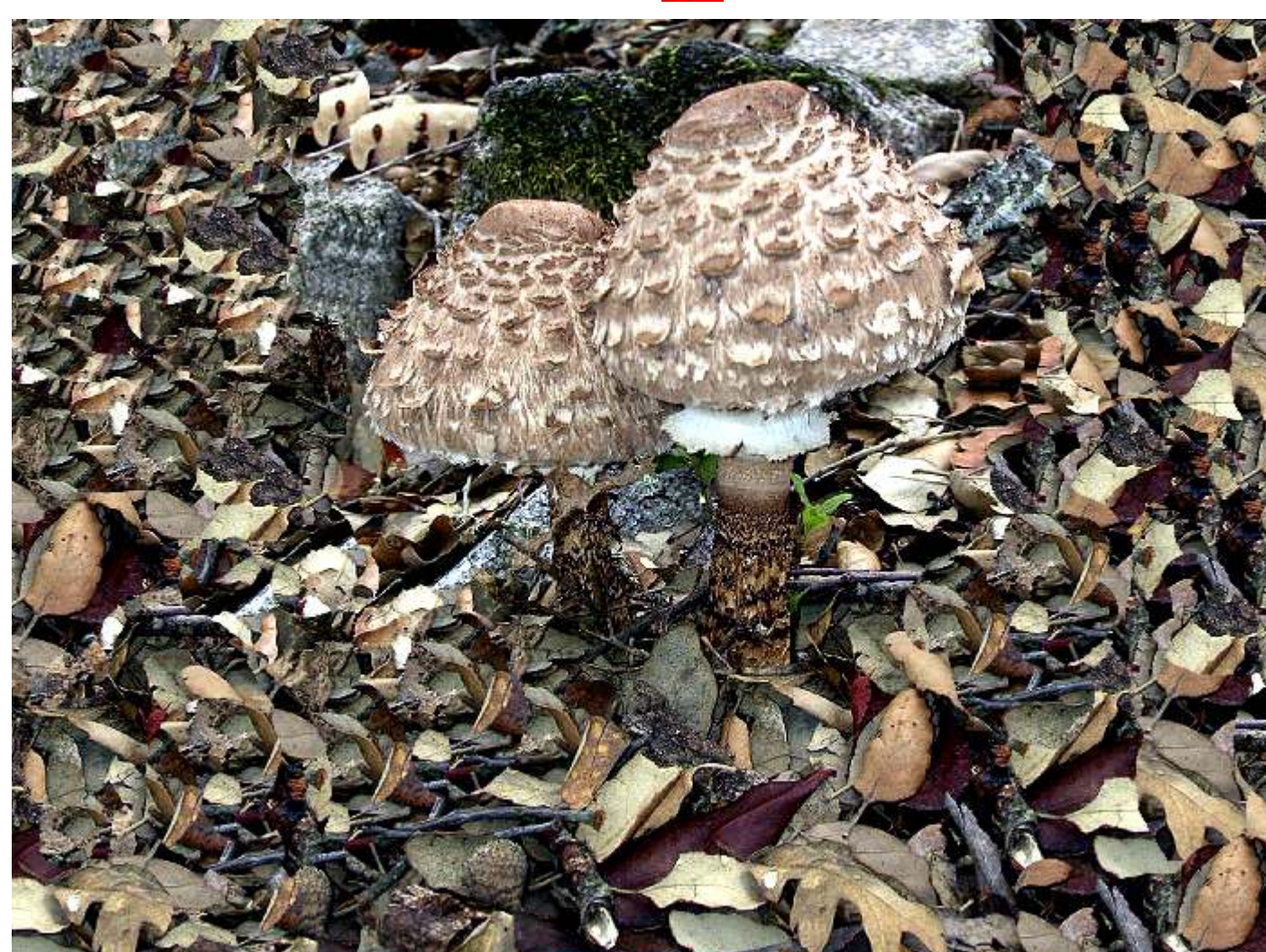
Macrolepiota procera (Frade)