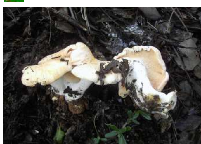
Hydnum repandum (Pata de borrego)