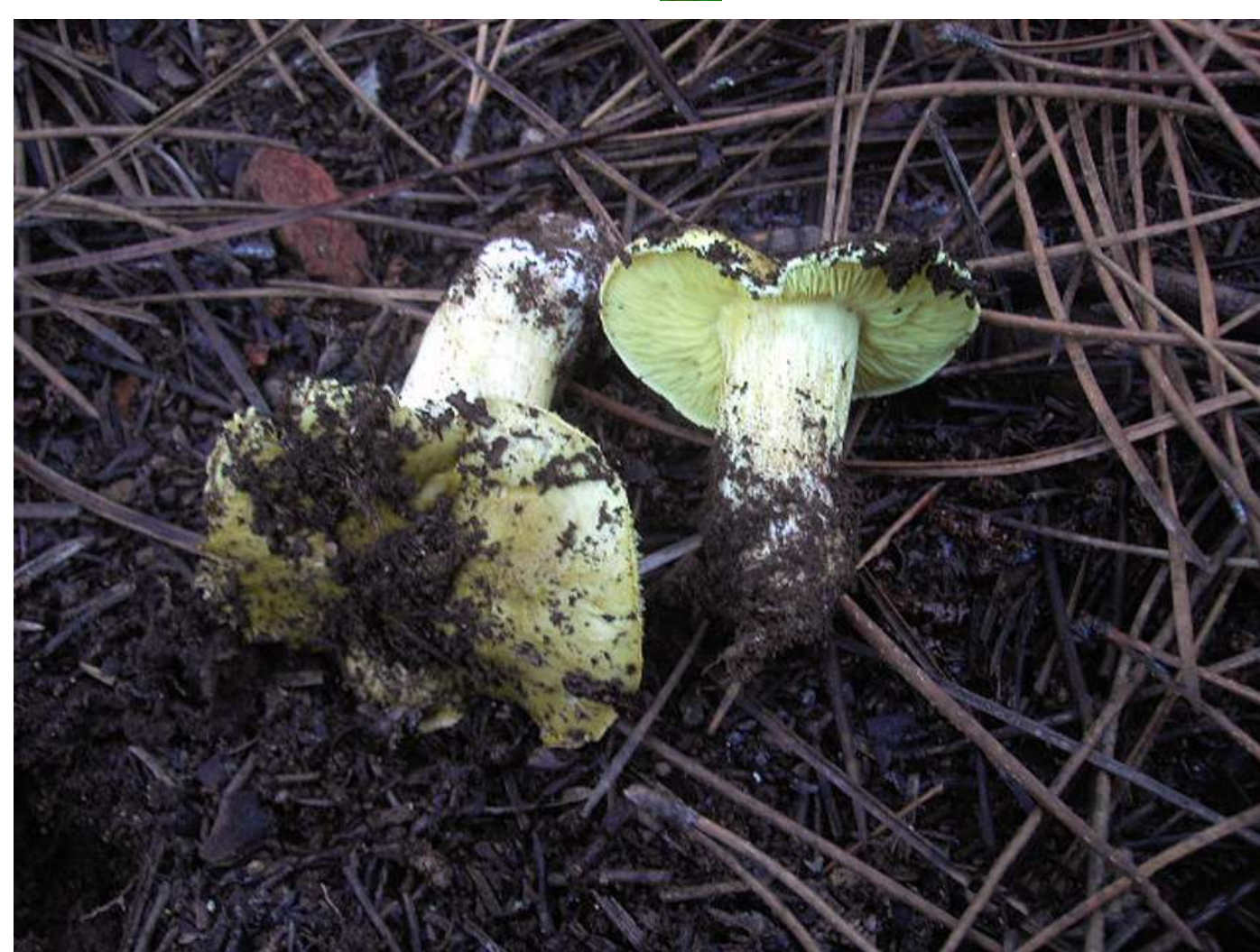
Tricholoma equestre (Miscaro amarelo)