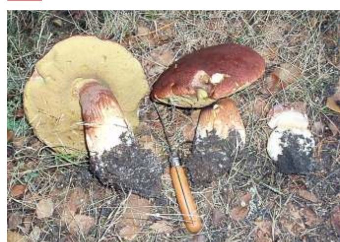
Boletus pinophilus (Boleto do pinheiro)