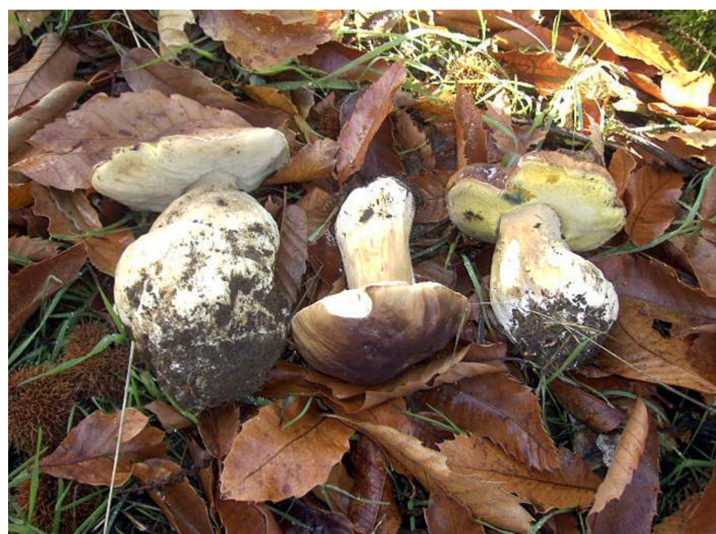
Boletus edulis (Cépa)