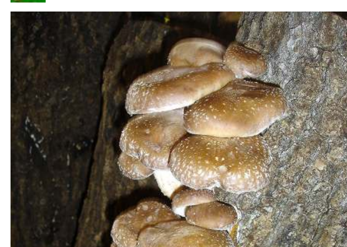
Lentinus edodes (Shitake)