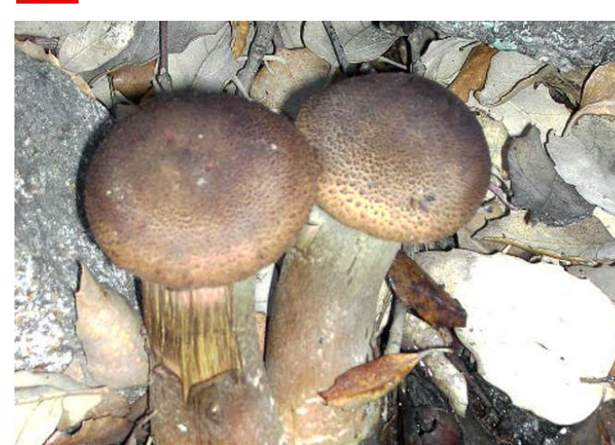
Armillaria mellea (Tarlhico)